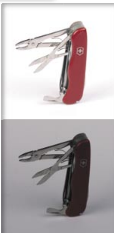
Soggetto su cartoncino bianco.

Una volta scelta l'inquadratura occorre decidere come eseguire l'esposizione; abbiamo visto che non è facile scegliere la