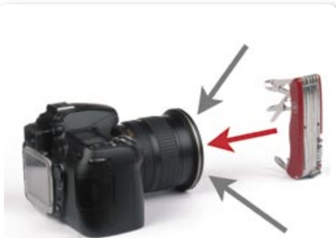
Nella misurazione in luce riflessa l'esposimetro della fotocamera valuta tutta la luce riflessa dalla scena, non solo quella riflessa dal soggetto.