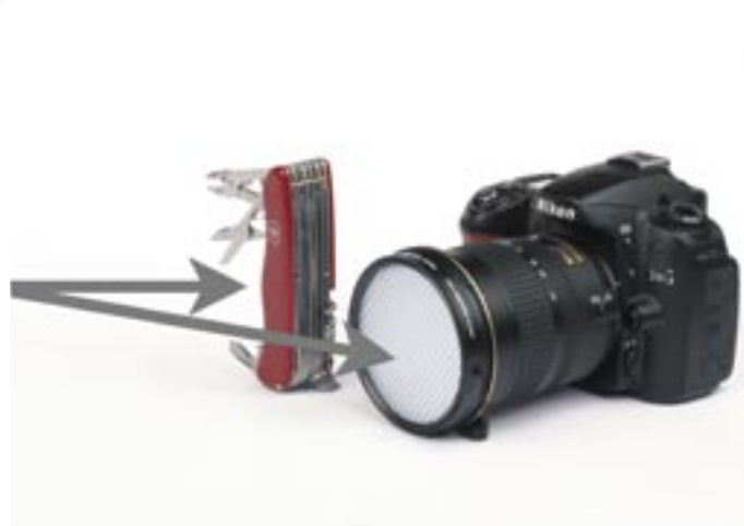
Misurando la luce incidente l'esposimetro della fotocamera valuta l'intensità della fonte di illuminazione, senza tenere conto delle riflessioni dello sfondo e del soggetto.

salvare i dettagli nelle zone molto scure e in quelle di alta luminosità; quest'ultima in particolare è la situazione più delicata perché mentre vi sono notevoli margini per recuperare le zone sottoesposte, in quelle bruciate manca completamente l'informazione per cui non vi è fotoritocco che possa salvarle.