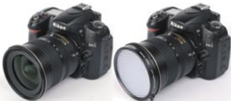
Expodisc montato su Nikon D80 con 12-24mm.