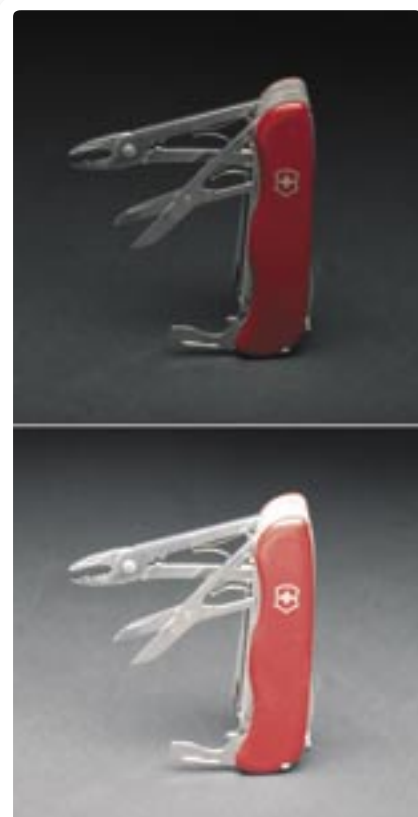
Soggetto su un cartoncino nero.

In basso misurando la luce riflessa: l'esposimetro interno della fotocamera ha tenuto conto della forte riflessione dello sfondo bianco e ha generato un'immagine sottoesposta.